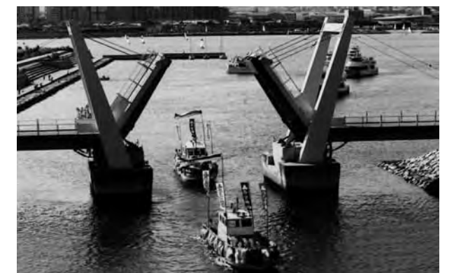
昨年の船渡御の様子。跳ね橋(御前浜橋)付近。

※西宮まつり 9月21日の「宵宮祭」、9月22日の「例祭」「子ども構みこし」、9月23日の「神輿渡御」を中心に各種の催し物が行なわれ、西宮の町が賑わう3日間です。